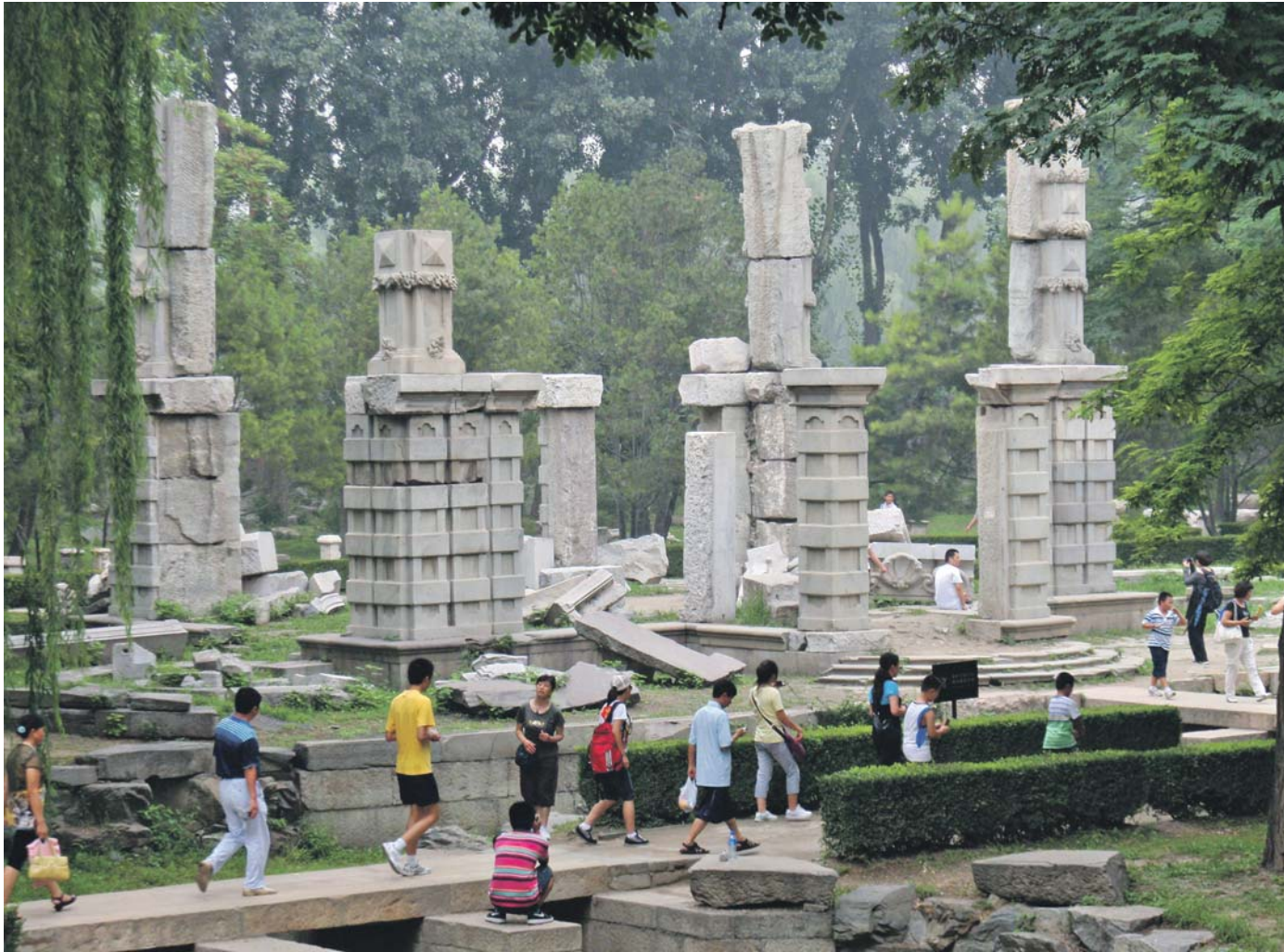
De ruïnes van Yuanmingyuan zijn tegenwoordig een trekpleister voor toeristen.

de kunstdepots – de prijs werd per kilo bepaald. Deze bedrijvigheid leidde ook op het platteland tot nieuwe plunderingen. Tegen de tijd dat de Chinese economie echt warm liep, in de jaren negentig, waren er nauwelijks meer originele stukken op de markt. Daarentegen bezitten de Verenigde Staten enkele van de beste collecties Sinica ter wereld. Becker: ‘China was ontdaan van vijfduizend jaar kunst, slechts gebouwen waren over, gestript van de objecten die elke tempel, ieder paleis of huis hun onvervangbare patina geven.’ Inmiddels moeten de gebouwen zelf het ontgelden.