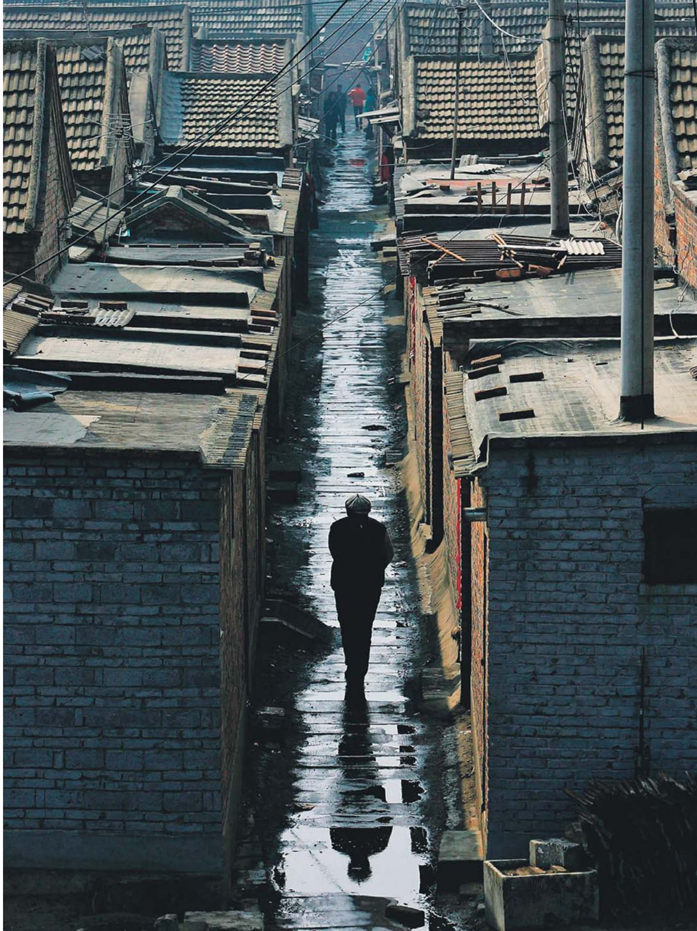
Een hutong, een van de karakteristieke Beijingse wijken van laagbouw rond binnenplaatsen.

en Rem Koolhaas, de Chinese leiders als progressief.' De auteur klaagt deze Europeanen aan als willige propagandisten van de dictatuur. Koolhaas verwelkomt zelfs expliciet de Chinese mogelijkheden om onscrupuleuze 'hyperarchitectuur' uit de grond te stampen.