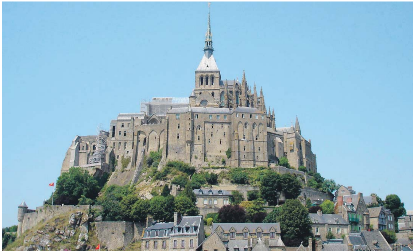
Waren de vertalingen van Aristoteles uit Mont-Saint-Michel doorslaggevender voor de intellectuele opbloei dan Arabische vertalingen?