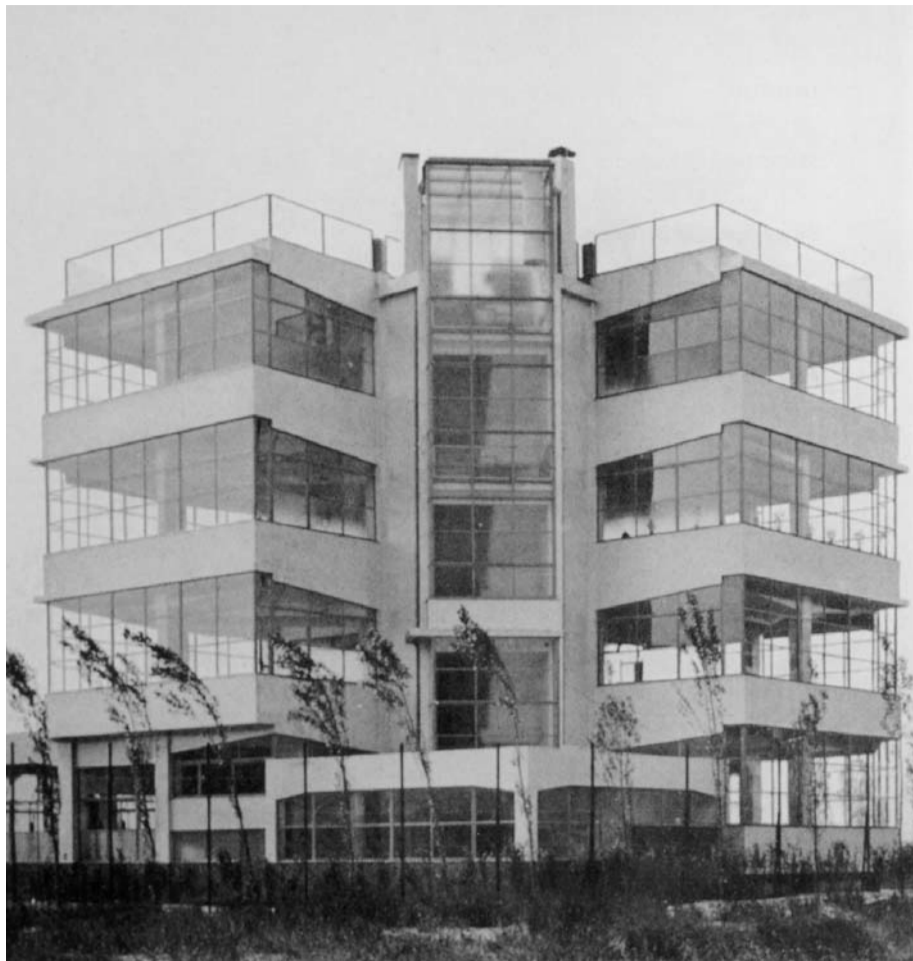
Amsterdam, Openluchtschool (J. Duiker, 1929 – 1930). Een van de iconen van het modernisme.

Volgens de canonieke geschiedschrijving was het scheppen van een daadwerkelijk moderne architectuur, in reactie op