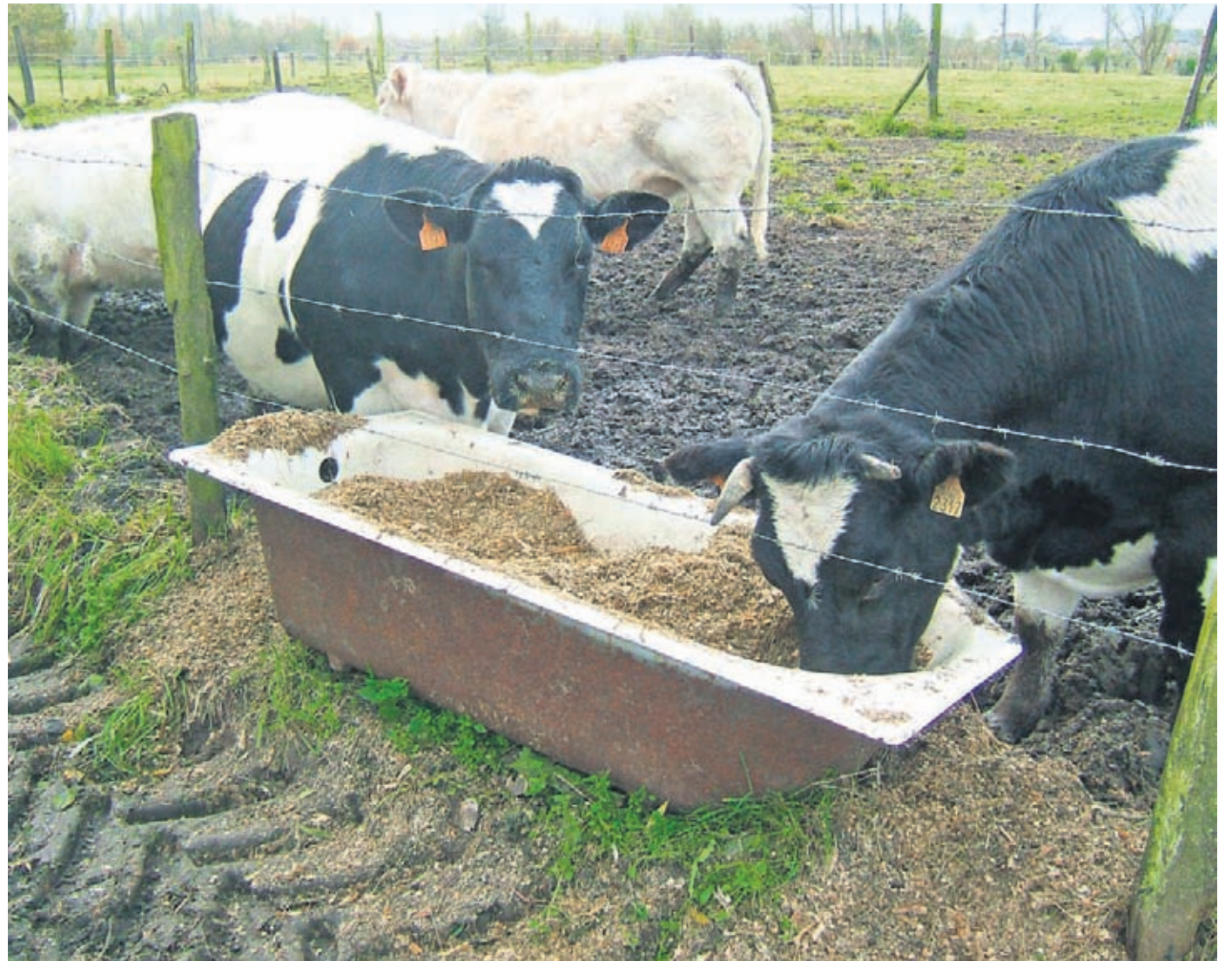
'Kloppen die verhalen wel, over de milieunadelige conversie bij koeien van 10 kilo graan tot 1 kilo rundvlees?'

Meat the Truth geeft een overzicht van de argumenten van de tegenstanders van vlees eten. Deze argumenten zijn inmiddels behoorlijk bekend: naast de uitstoot van broeikasgassen door winden en boeren van koeien en bij de verbouw van graan en soja en het transport daarvan,