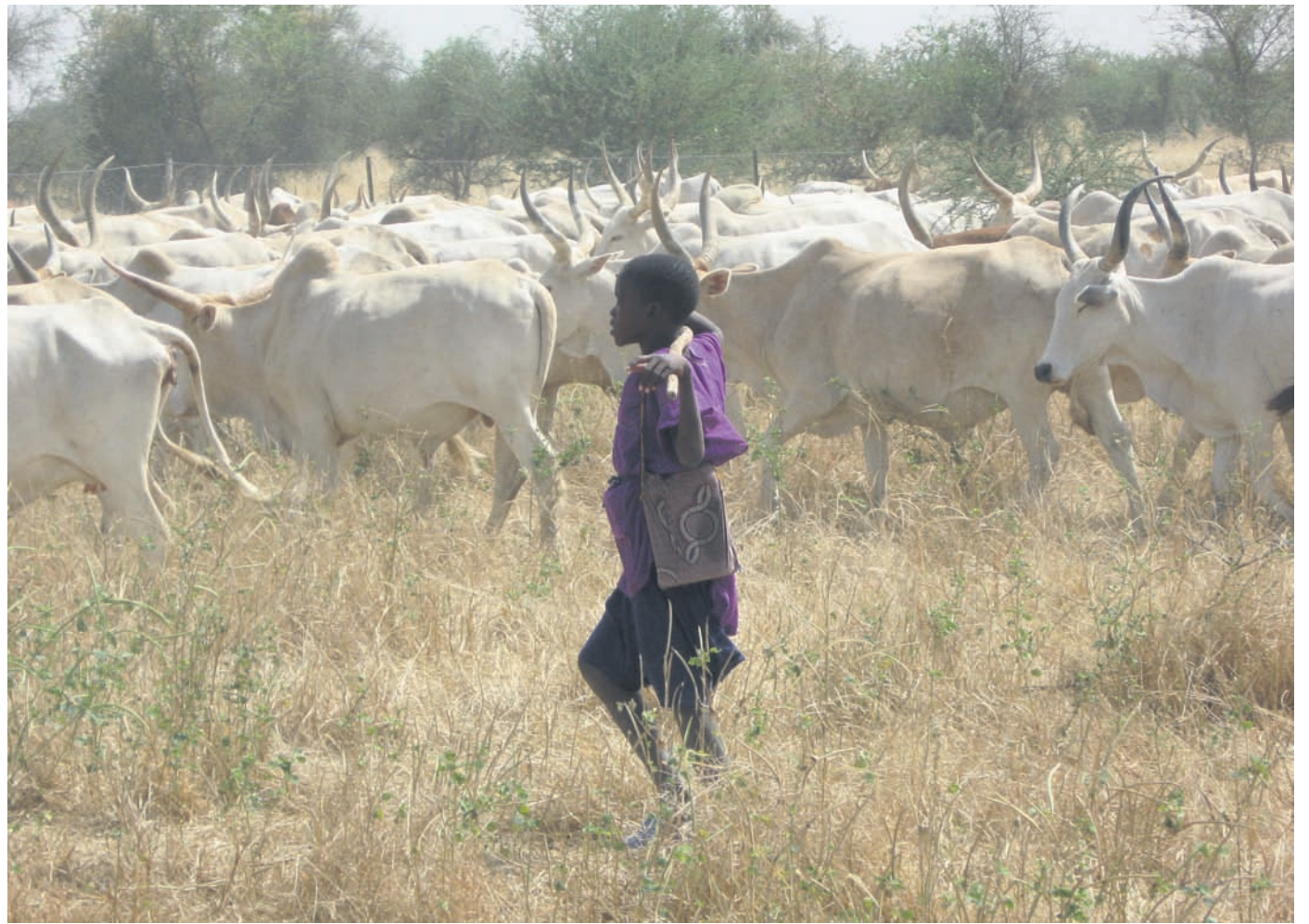
Waarom lopen dieren niet meer gewoon naar de plek waar we ze willen hebben?

Mijn evaluatie van het boek kan niet heel positief zijn; het bevat enkele goede hoofdstukken, maar er is geen enkel redactiewerk gedaan. In bijna alle hoofdstukken wordt het FAO-rapport samengevat, er is door het boek heen veel overlap en er worden veel cijfers gepresenteerd zonder de opbouw ervan te verklaren. Soms spreken de cijfers elkaar zelfs tegen, zoals die over de hoeveelheden