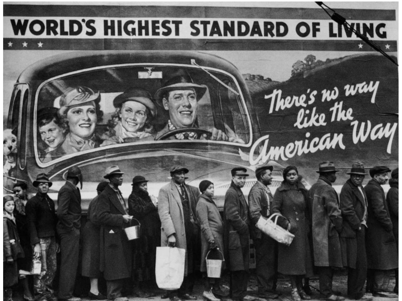
De armoede van de zwarte bevolking zorgde voor achterstand, segregatie en criminaliteit.

CRIMINOLOGICAL PERSPECTIVES ON RACE AND CRIME (SECOND EDITION) door Shaun L. Gabbidon. Routledge. New York/Londen 2010. 282 pag. € 46,50