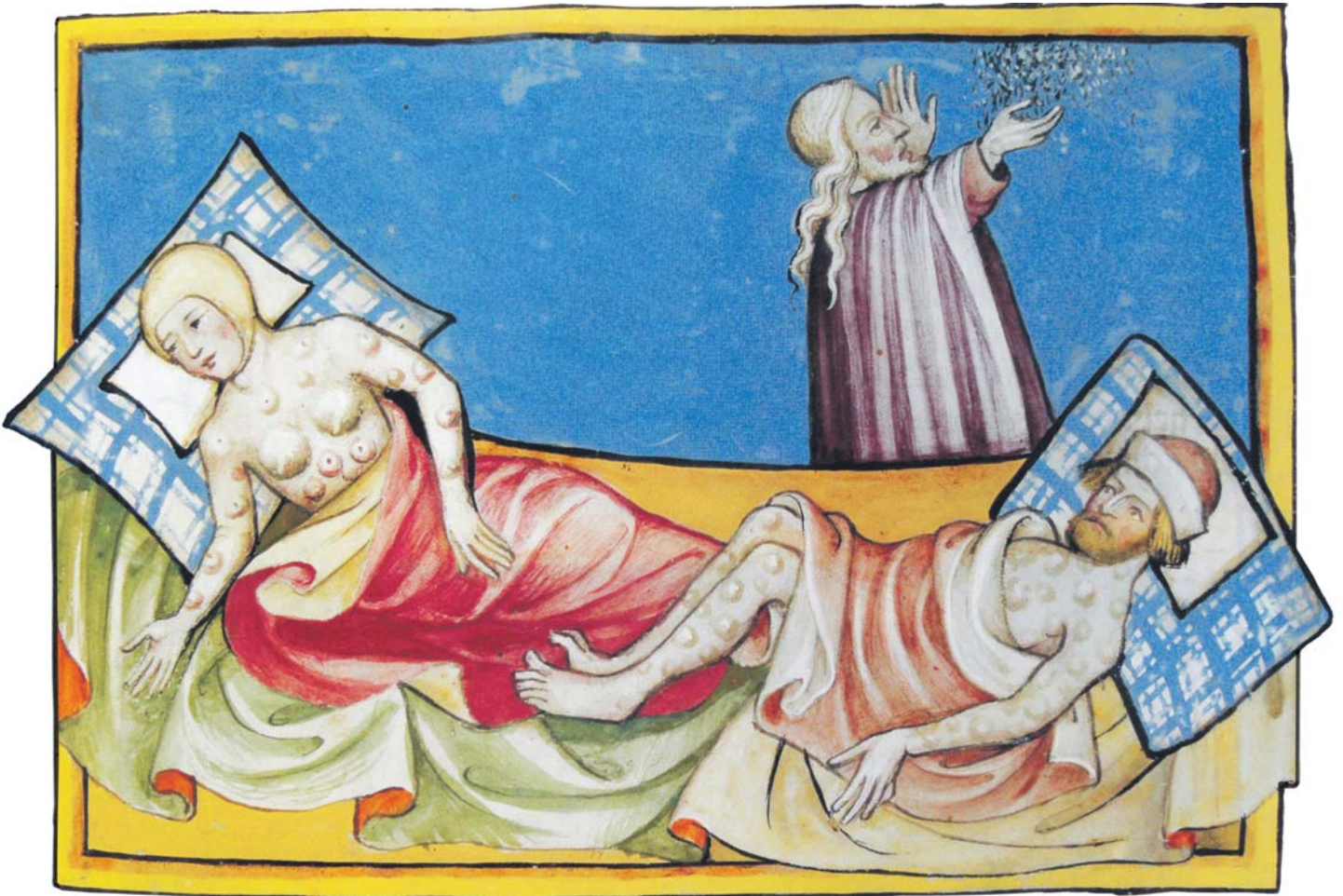
Door de veertiende-eeuwse pestepidemie stierf een derde van de Europeanen. Illustratie uit de Toggenburg-bijbel (1411).

Tegelijk creëerde de sterfte juist ook ruimte om nieuwe initiatieven te ontplooien. De Amerikaanse historicus