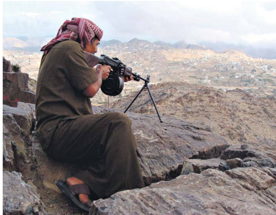
Saoedi-Arabië associëren we met terrorisme.

Hoe komt het dat Soedi-Arabië, een immens rijk land met de oppervlakte van een klein continent en ongeveer dertig miljoen inwoners, zich zo vereenzelvigd heeft met islamitisch puritanisme en terrorisme? Twee auteurs – de een journalist en schrijver, de ander academicus – verdienen de aandacht van iedereen die hierover meer wil weten. De Brit Robert Lacey verbleef drie jaar in het Saoedische koninkrijk voor het schrijven van Inside the Kingdom , een vervolg op zijn boek The